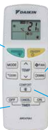
Daljinski upravljač za FTXF-A

omogućuje programiranje jedinice, što uključuje uključivanje/isključivanje i postavljanje noćnog načina rada* *1 sat nakon aktivacije noćnog načina rada, postavljena vrijednost povećava se za hlađenje ili se smanjuje u slučaju grijanja – tako se postiže ugodno okruženje za vrijeme spavanja